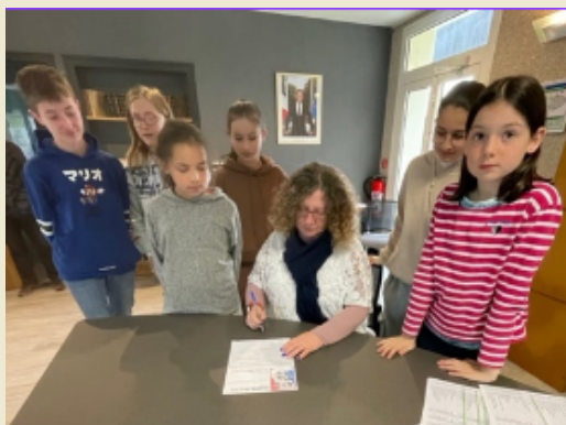
Signature de la charte après en avoir fait une lecture solennelle, à tour de rôle, devant les élus du Conseil Municipal.

Enfin, Madame le Maire a signé en séance la charte d'engagement des élus au CCJ qu'ils ont coconstruite et intitulé " on ne nait pas citoyen, on le devient ".